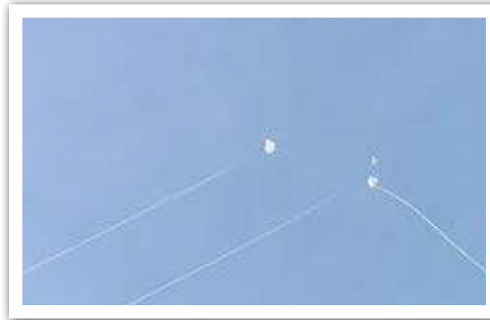
מפגש של טיל עם 'כיפת ברזל' ביירוט.

הקב"ה מחליט מה יקרה עם כל טיל האס יצליחו לַיִרֵט אותו, היכן ייפול ומה יהיה במקום הזה.