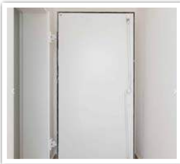
דלת עם סגירה של פלדה.