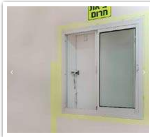
חלון עם סגירה של פלדה.